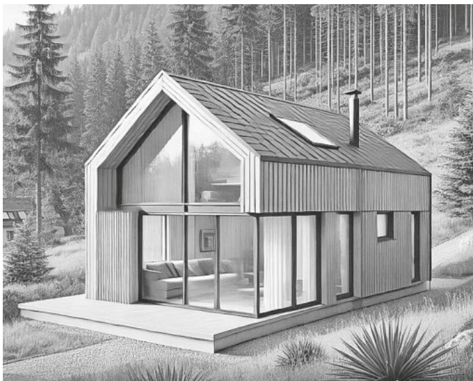
Beispiel eines geplanten Mini-Ferienhauses

Ihre Angebote oder Hinweise, die wir vertraulich an den Investor weiterleiten, richten Sie bitte an die Gemeinde Buchenbach, Hauptstraße 20, 79256 Buchenbach oder per Mail an buergenmeister@buchenbach.de